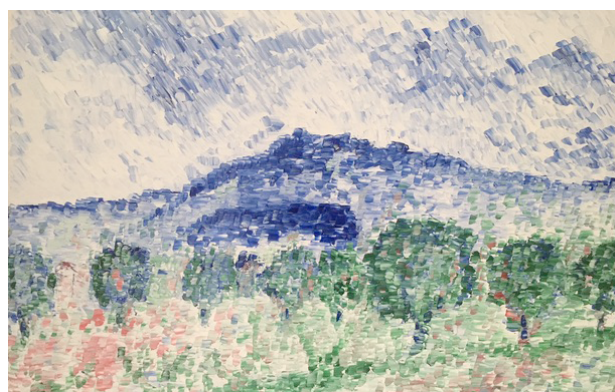
Guillaume Genadot - Peinture