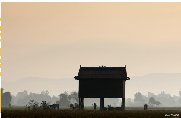
Keat Tunier - Photographie