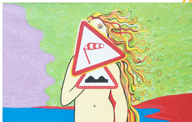
Marina DH - Peinture